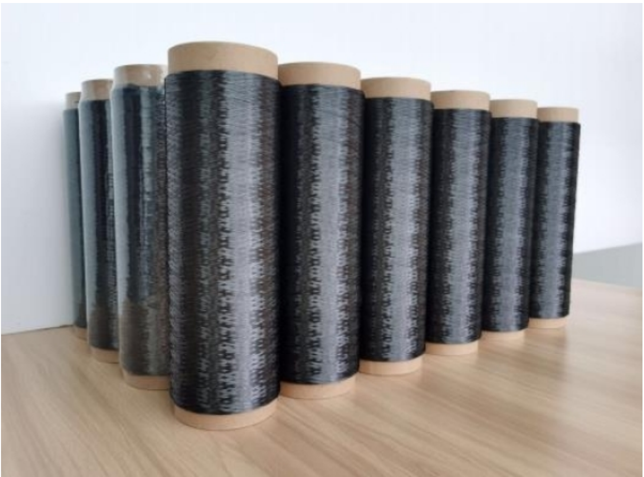
图2 新下线的连续SiC复相陶瓷纤维