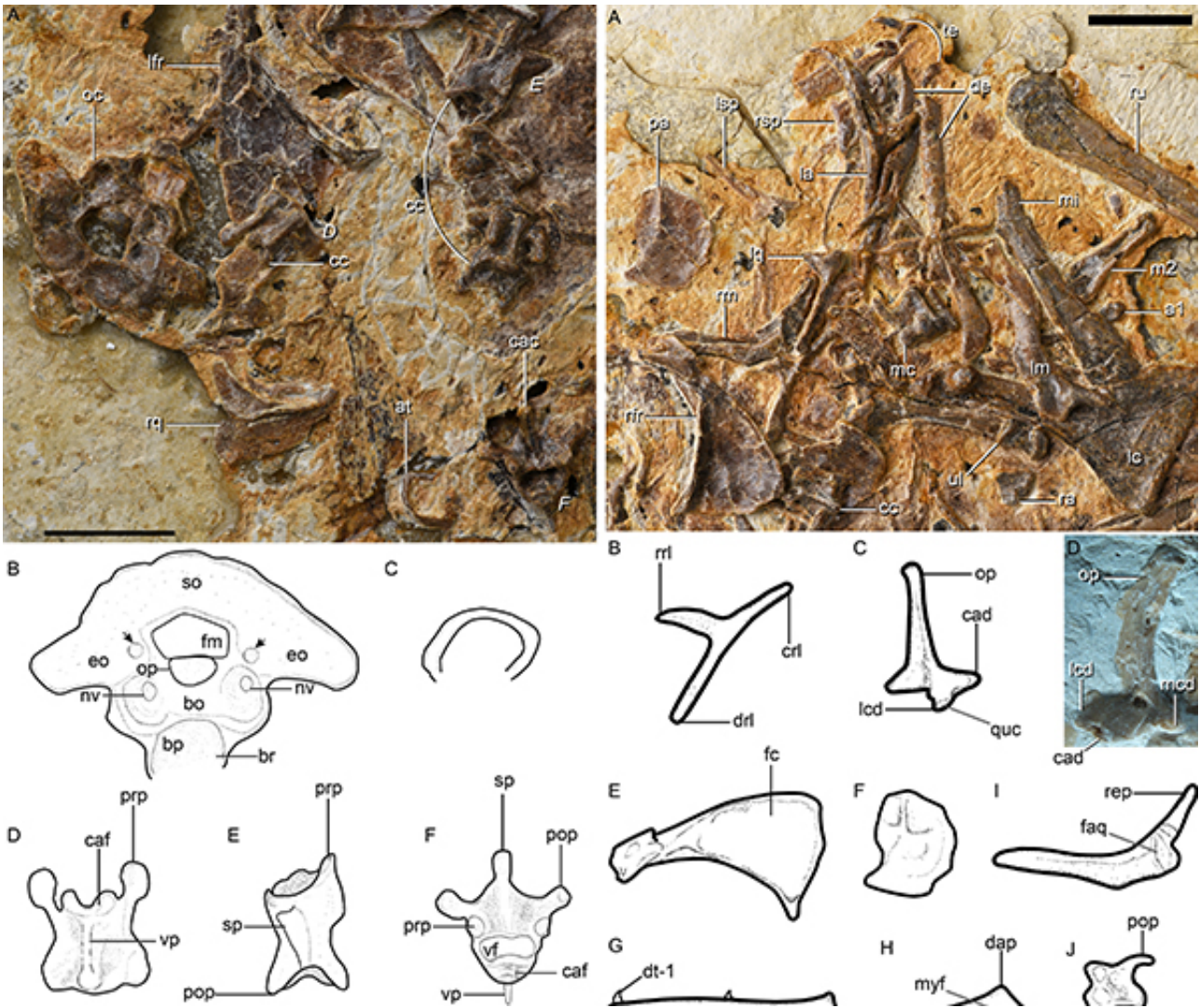
图2. 奇异食鱼反鸟头骨和椎体解剖特征