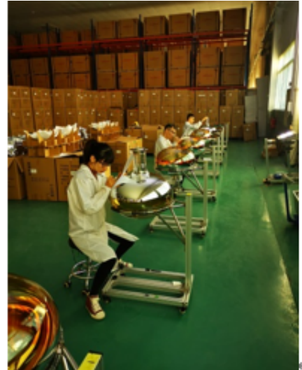
光电倍增管外观质量检查