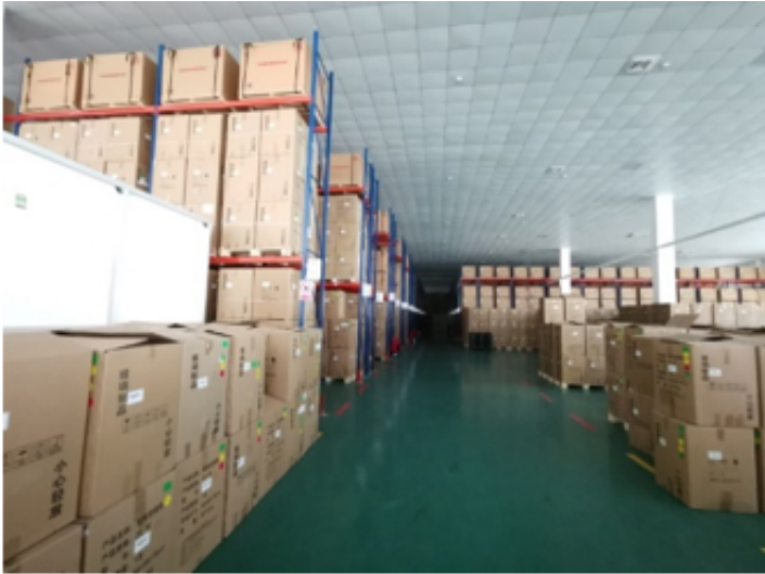
已交付的 2 万只 20 英寸光电倍增管