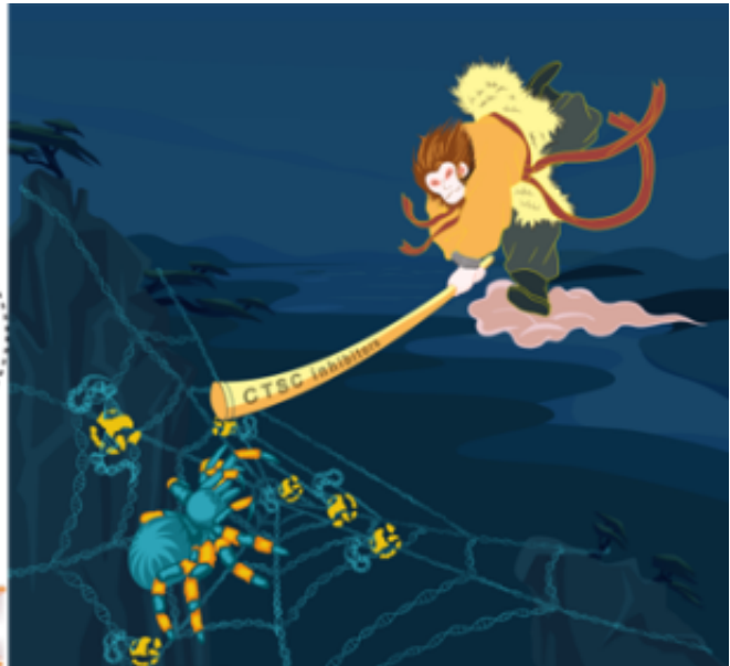
CTSC调控中性粒细胞及乳腺癌肺转移的功能机制模式及卡通示意图