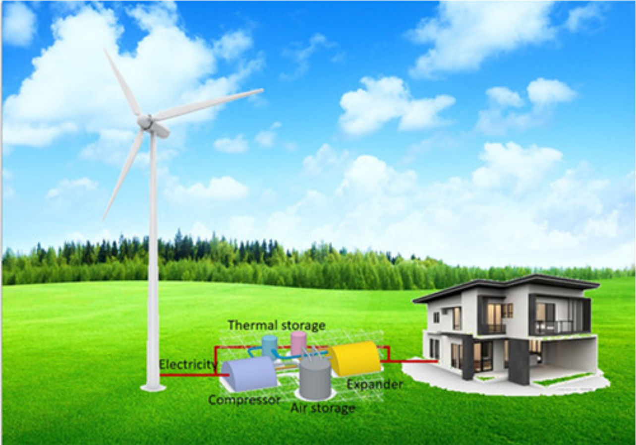
图1. “源-荷-储”系统示意图