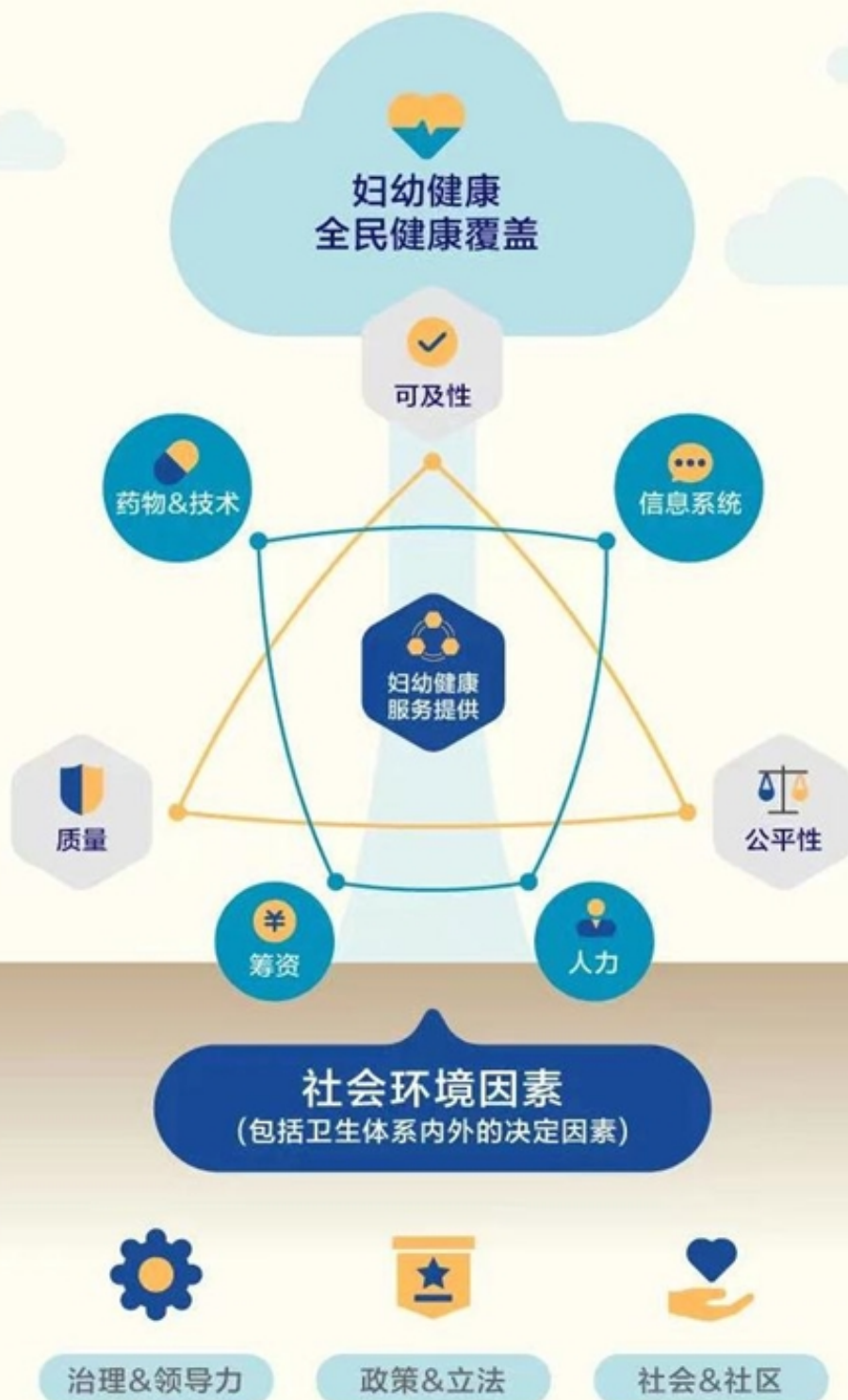
图：面向健康中国2030的妇幼健康策略框架 (注：该策略框架由The Lancet Commission on RMNCAH in China首次提出)