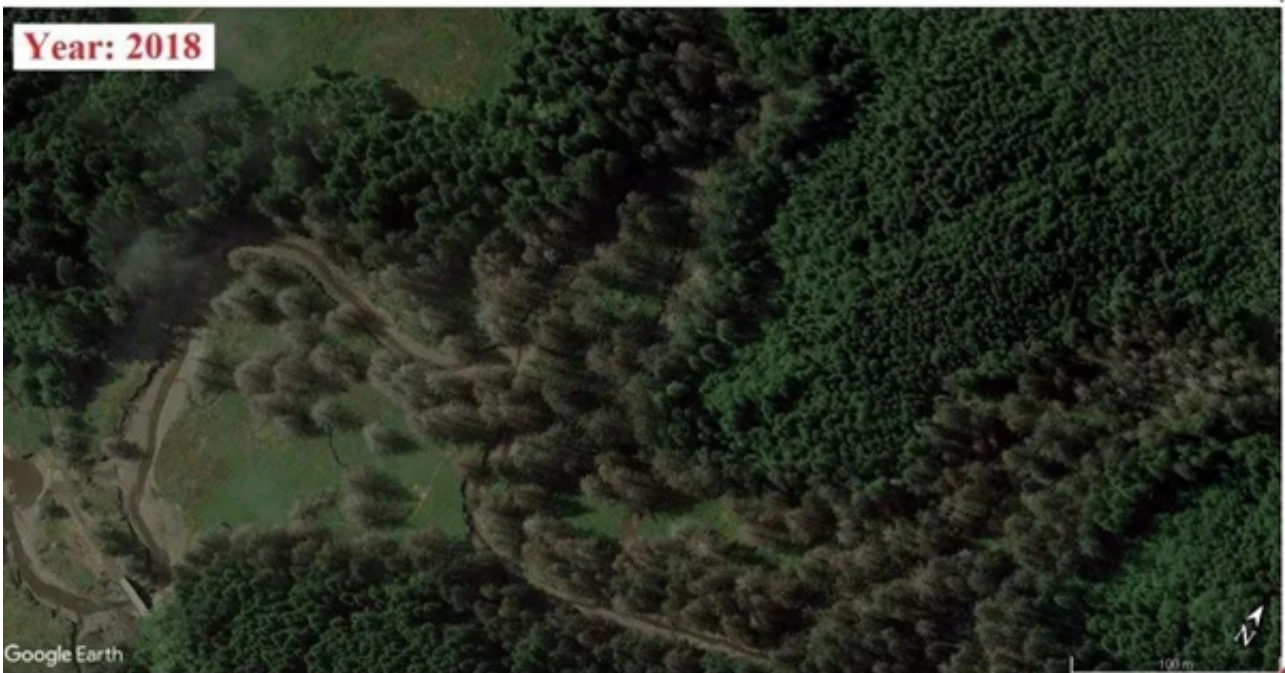
图1.2013年和2018年树木死亡的卫星对比图像