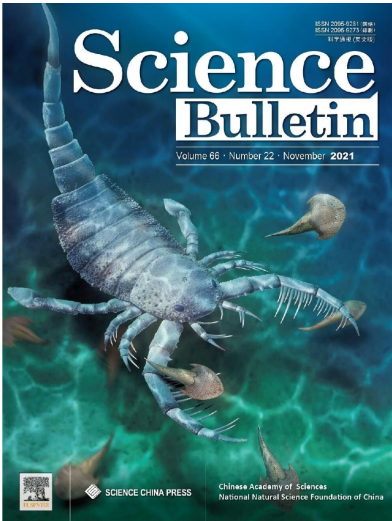
图1.Science Bulletin封面（秀山恐鲎生态复原图由杨定华绘制）