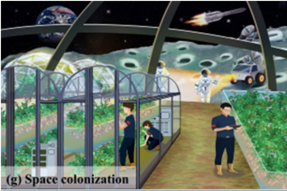
面向太空农业的WBEEP作物的创制与应用

随着人类探索太空的步伐不断加快，以空间食物保障为核心的太空农业将会引起越来越广泛的关注。近日，中国农业科学院都市农业研究所在《自然—通讯》发表展望性文章，深入分析了太空农业系统对作物的独特要求，创新性地提出了面向太空农场进行作物改良的全株可食精英植物策略。