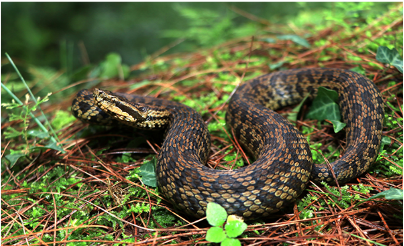
图1.喜山蝮是亚洲蝮属种唯一分布于喜马拉雅山南麓的物种（Rohit Giri，摄于尼泊尔博卡拉）