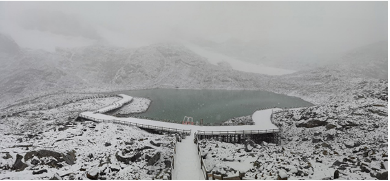
图5.新种冰川蝮栖息地附近的冰川湖