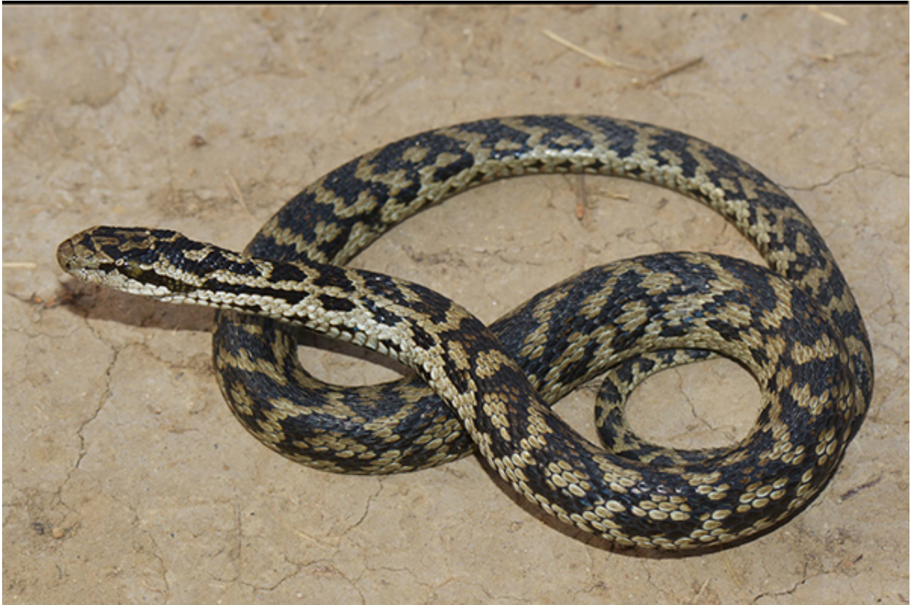
图3.新种怒江蝮（ Gloydus lipipengi ）生态照