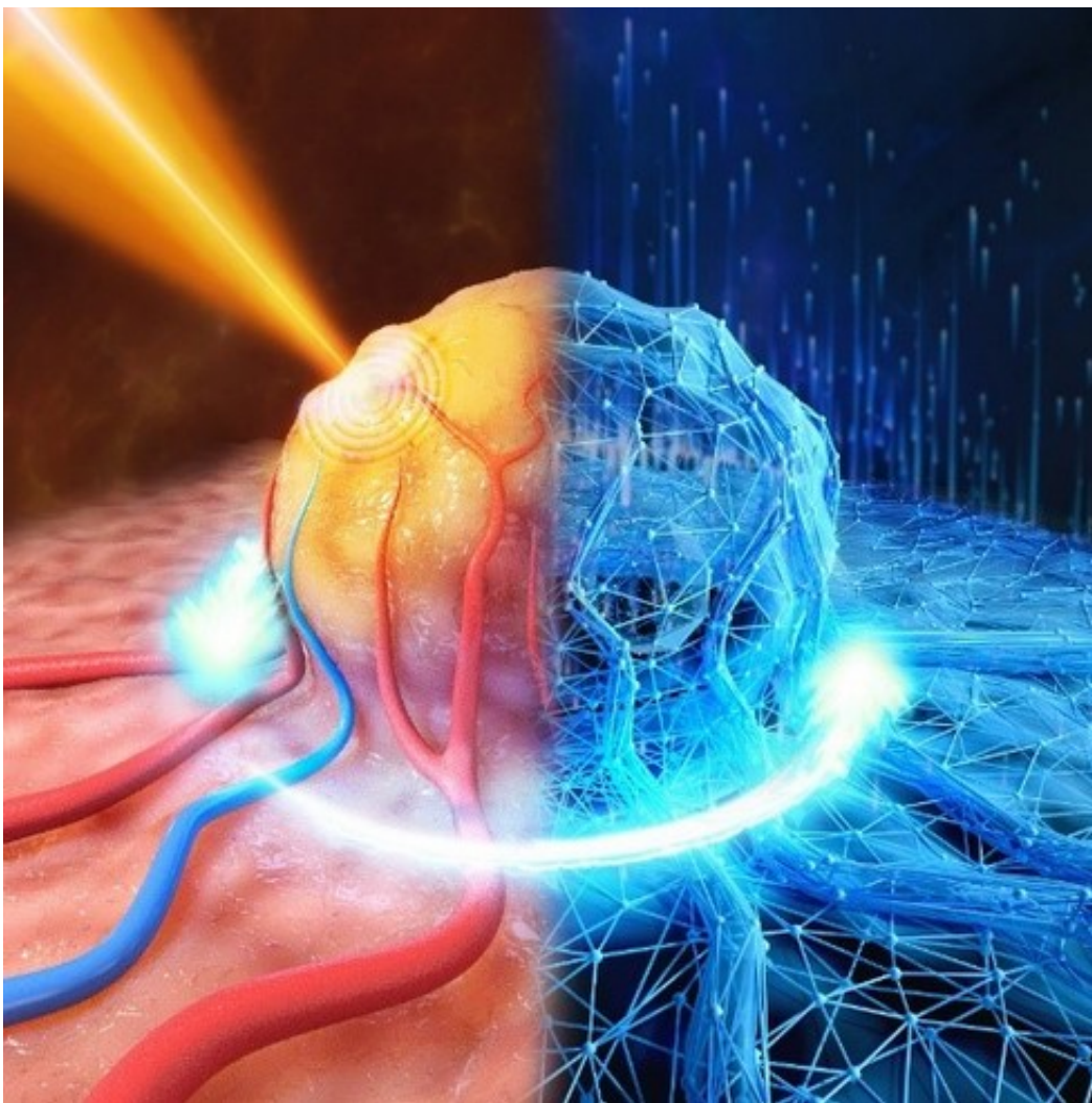
定量光声层析成像深度学习方法的功​​能效果图

相关论文信息： https://doi.org/10.1364/OPTICA.438502