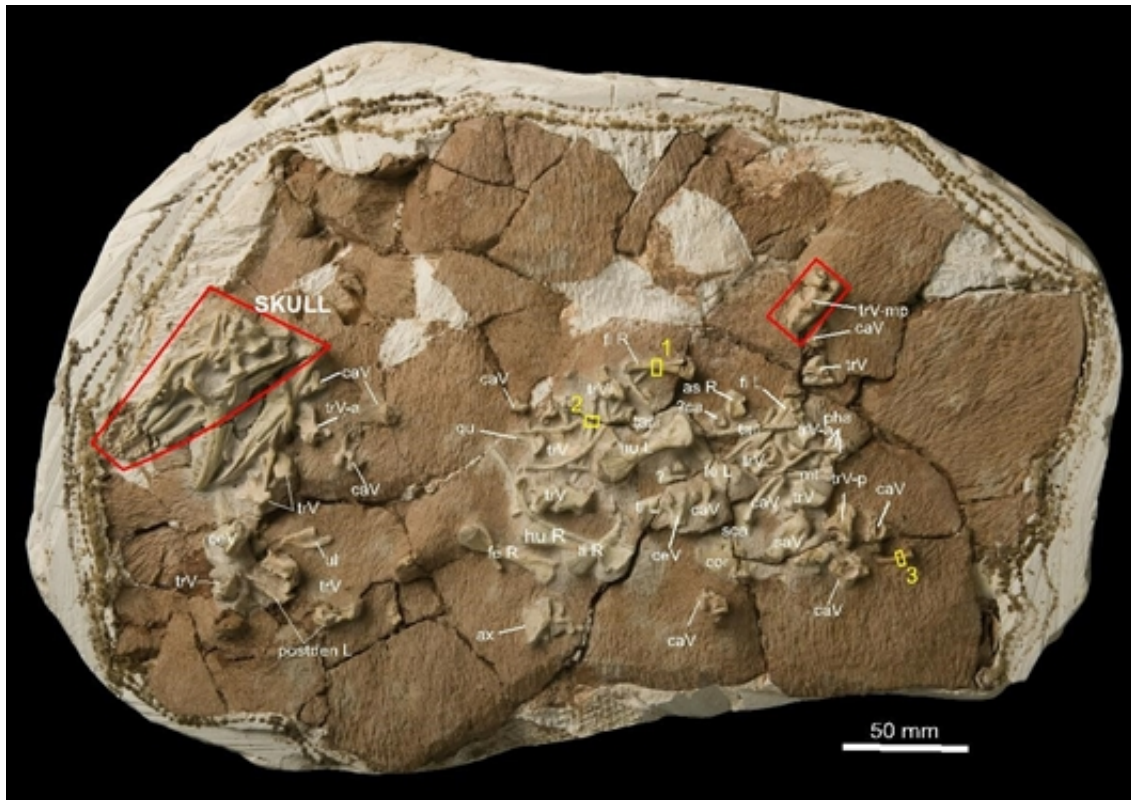
李氏始祖巨蜥 ( Archaeovaranus lii ) 正型标本

2月7日，中国科学院古脊椎动物与古人类研究所董丽萍、王元青、赵祺、王原与英国、瑞士同行合作在《英国皇家学会自然科学会报B辑》杂志以封面文章发表了有关巨蜥类演化的研究成果：亚洲始新世一基干巨蜥科新属种补充了巨蜥科蜥蜴亚洲起源说的证据链，说明在亚洲存在由巨蜥型类向巨蜥科演化的过渡阶段。