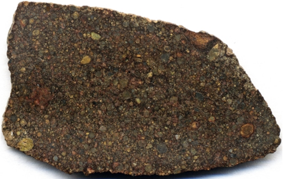
非炭质普通球粒陨石。