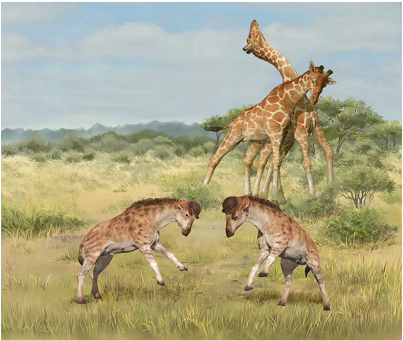
图1.长颈鹿类雄性斗争的对比，前景为獬豸盘角鹿，远景为长颈鹿