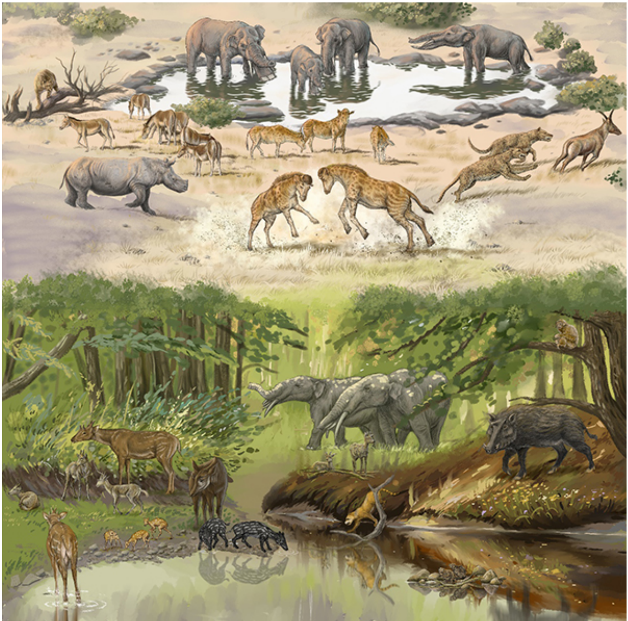
图3.准噶尔盆地1700万年前的动物群，正中间为獬豸盘角鹿