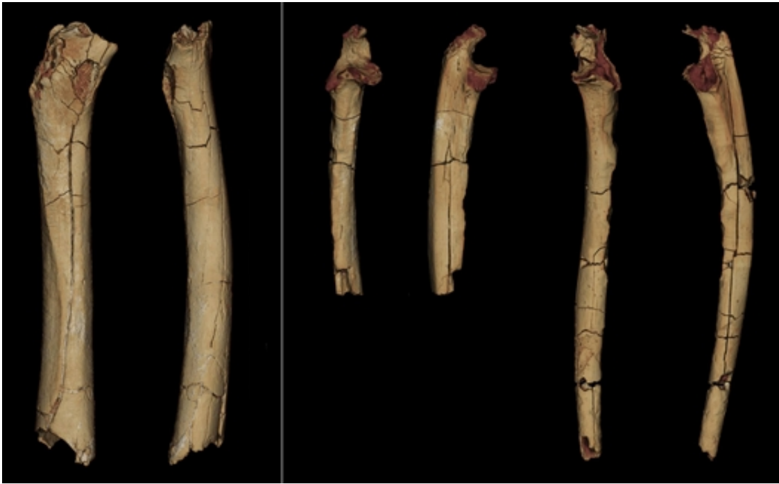
沙赫人骨骼材料的3D模型，从左到右依次为：股骨，后视图和中视图；右左尺骨，前视图和侧视图。