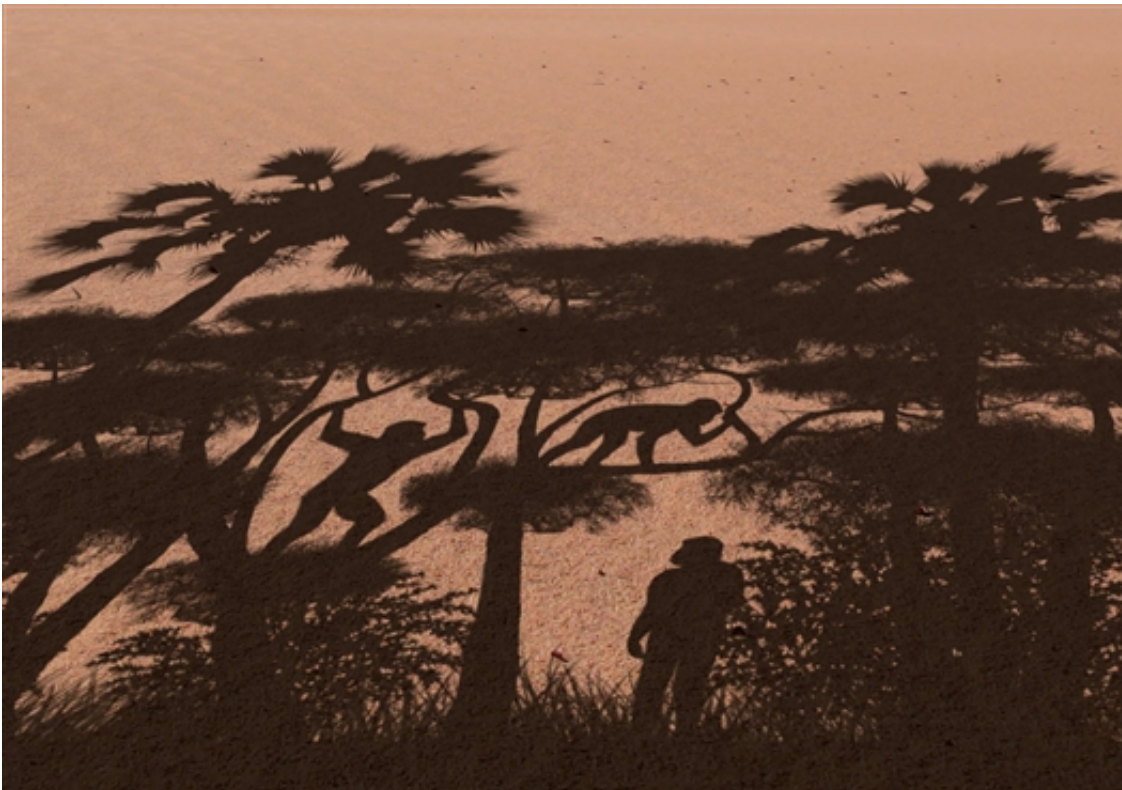
沙赫人运动模式的体现图。双足运动在这个族群中已非常普遍，可能在地面上也可能在树上，但在树上时与其他类型的运动共存，包括用手握辅助的四足运动，但模式明显与大猩猩和黑猩猩不同（后者适用趾骨的背面作为支撑）。