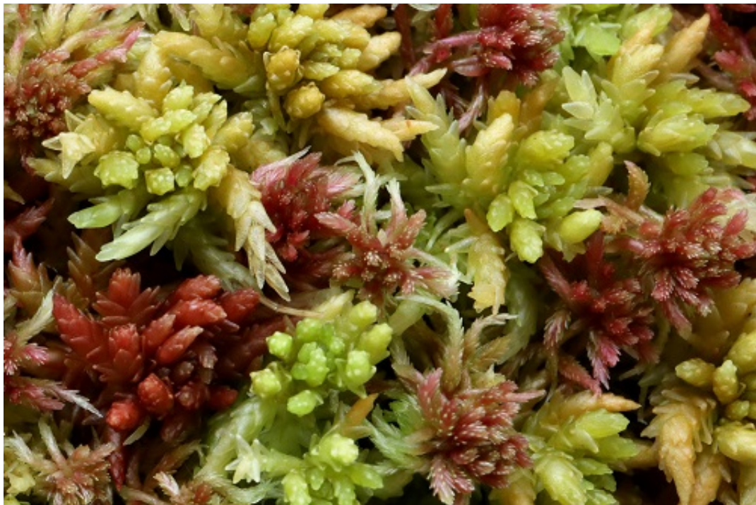
我国东北泥炭地泥炭藓群落

北方泥炭地南缘是碳汇向碳源转变风险区。泥炭地是全球最大的天然陆地碳库。尽管全球泥炭地的面积只占陆地表面的3%，但其存碳却约占全球土壤碳的1/3，是减缓全球气候变暖最有效的陆地生态系统。气候变化会导致全球泥炭地扩张或收缩吗？近日华东师大生命科学学院教授朱瑞良团队从泥炭藓上发现了新证据，相关研究已在《全球变化生物学》以封面文章形式发表。