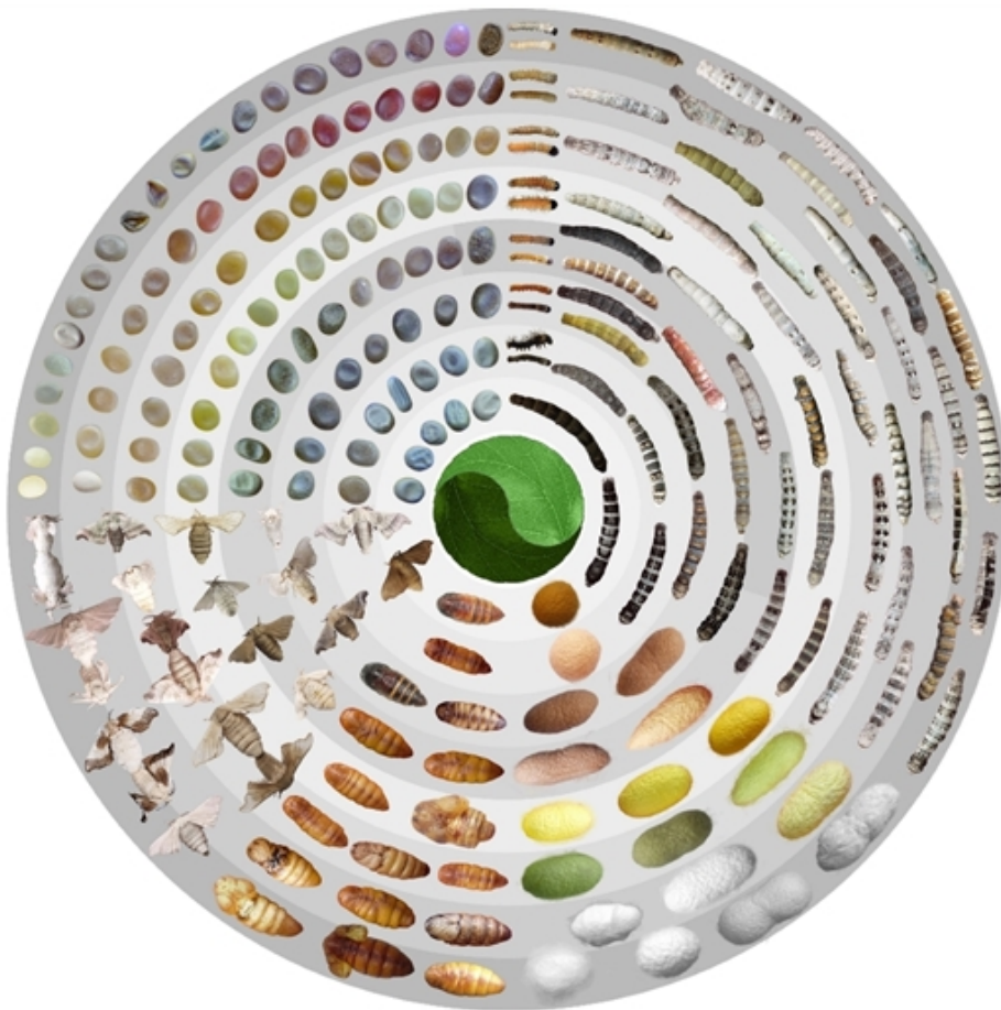
家蚕生命周期各阶段丰富的表型多样性