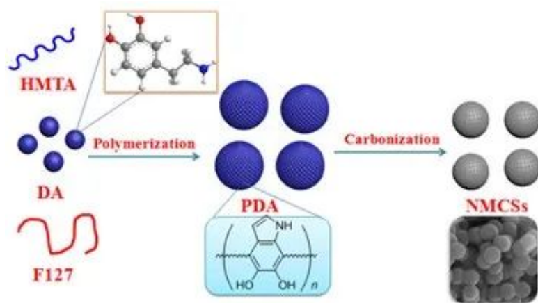
图1 NMCSs的合成过程示意图

以六亚甲基四胺为pH缓冲剂，表面活性剂F127为结构导向剂制备聚多巴胺纳米球，经碳化得到一系列单分散的氮杂纳米碳球材料（NMCSs-x-y，图1）。对纳米碳球的结构进行了系列表征，并研究了其作为超级电容器电极材料的电化学性能，主要结论如下：