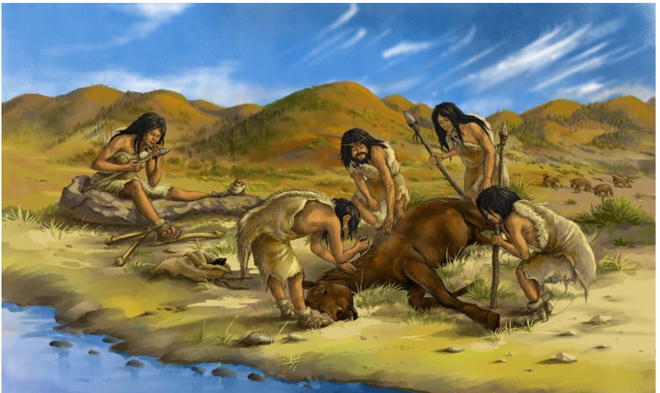
峙峪遗址狩猎人群生活复原图。郭肖聪绘

近日，《自然—生态与进化》在线发表了一项中外研究成果，展示了山西朔州峙峪遗址发现的距今4.5万年前的一系列现代性文化证据，更新了有关东亚地区现代人扩散及其文化发展的传统认知。