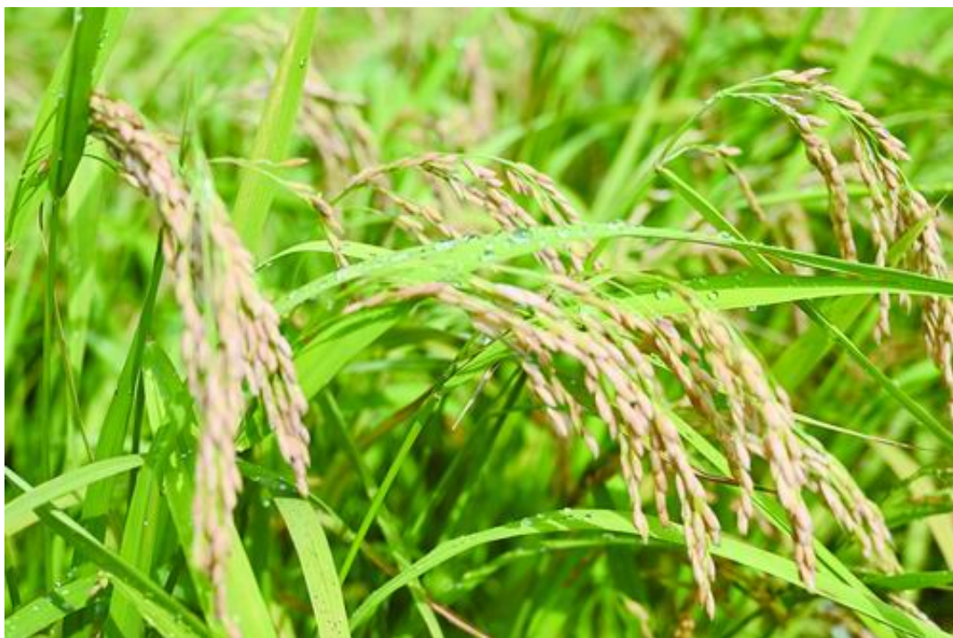
双季早粳稻。