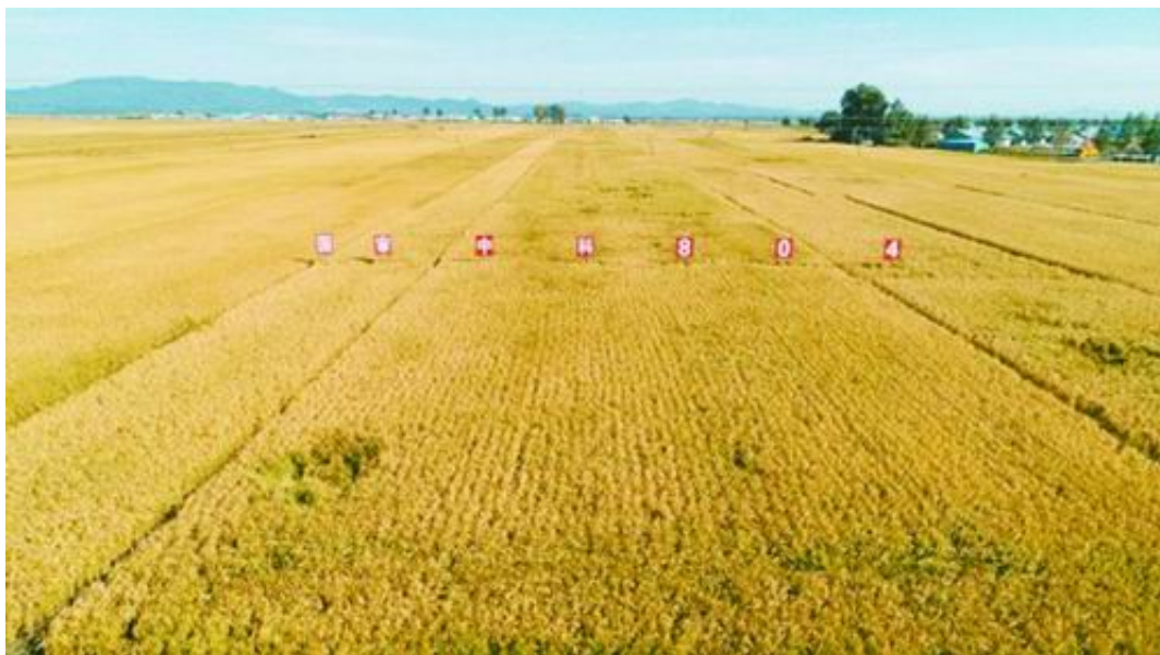
2018年“ 中科804 ”五常示范片现场。