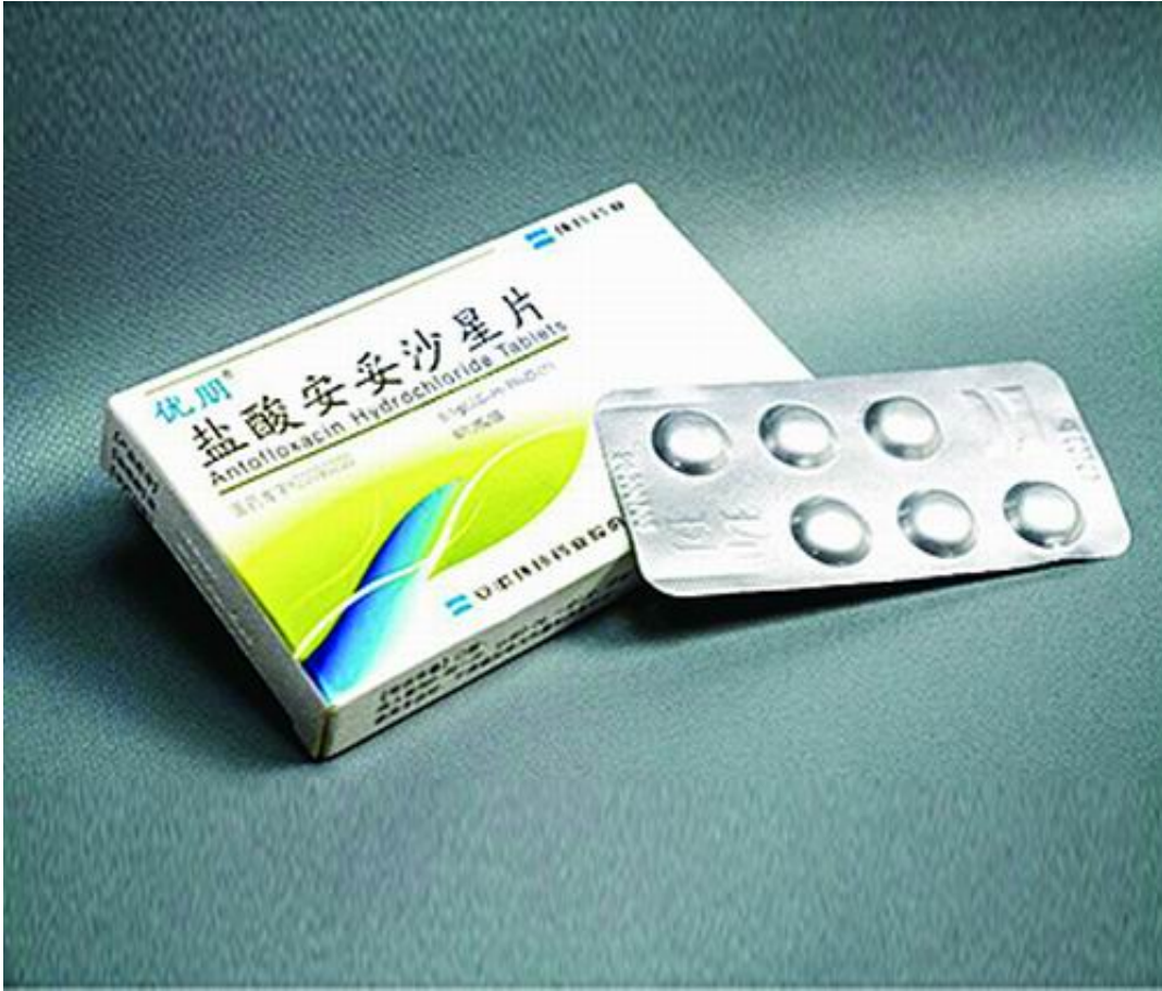
盐酸安妥沙星产品。