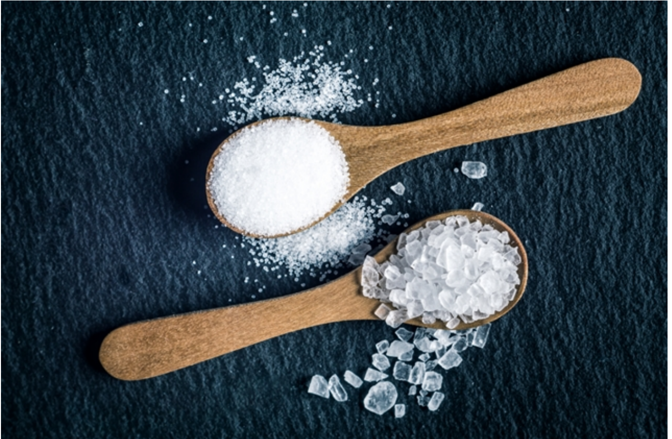
图1：不同颗粒度大小的粉末

最直白的颗粒度测量方式是将一勺粉末吹散，拿放大镜一粒一粒去数它们的尺寸大小。这就是目前主流的侵入式粒度仪的测量原理，将粉末放入测量腔体内，采用泵吸的方式使其分散并依次通过视窗，测量每个颗粒的尺寸并画出统计柱状图。这种方式的优点是测量原理简单易懂、精确度高，而其缺点是需要将粉末放入测量仪器，无法实现原位测量，且测量后的粉末易被污染，难以循环利用。在实际生产过程中，药粉被密封在真空腔体内部，取出粉末需要经过复杂的步骤，耗时极长。因此在一次干燥工艺中，操作员只会进行最多5-6次的颗粒度分布测量。