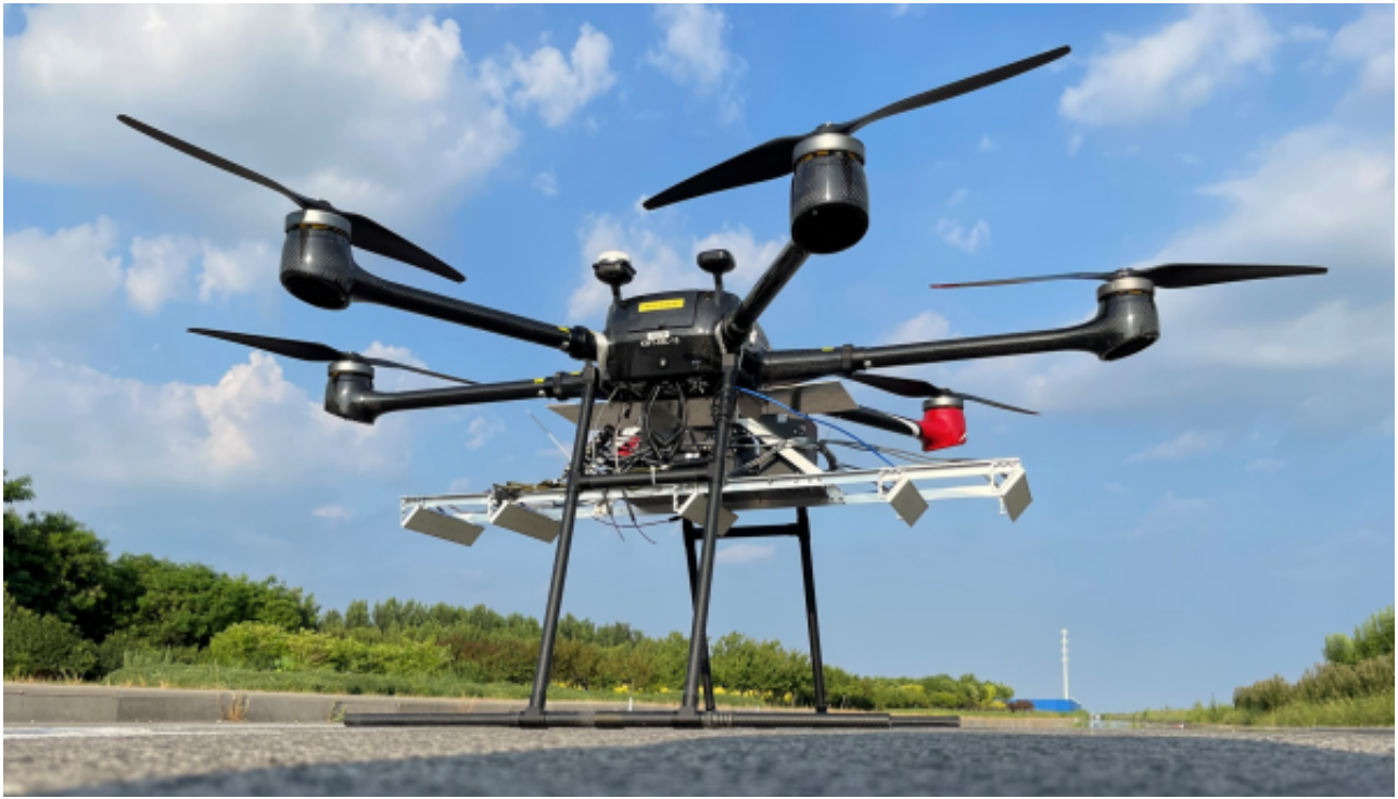
微波视觉三维SAR设备（MV3DSAR）