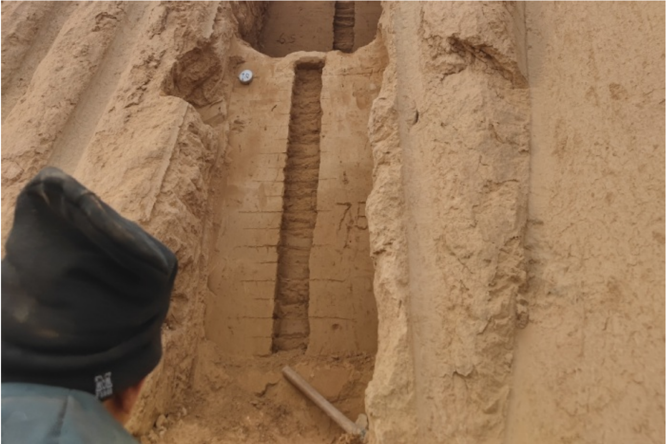
团队成员在野外采样。

当审稿意见在2025年春节前夕送达时，章泽科立即带领团队奔赴甘肃庆阳补采样品。腊月时节的黄土高原，寒风刺骨，地表冻土坚硬如铁。面对采样难题，他们用木工刨片配合榔头破土取样，最终才获取了所需黄土样本。