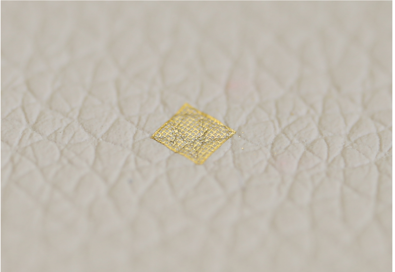
电子薄膜“温柔”贴合在目标表面的实物图片。