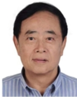
周守为 中国工程院院士 中海油集团