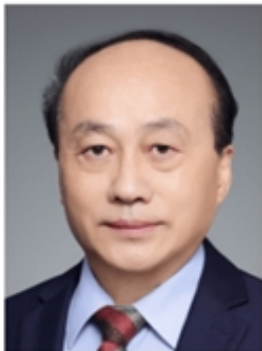
张久俊 加拿大三院院士 福州大学