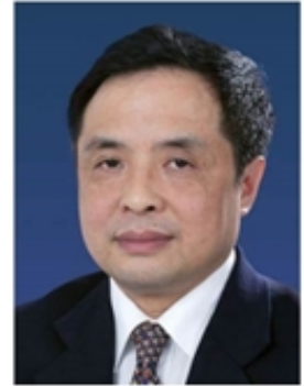
彭苏萍 中国工程院院士 中国矿业大学