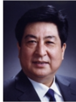
苏义脑 中国工程院院士 中石油集团工程 技术研究院