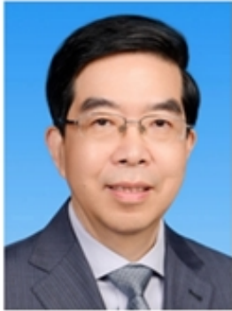
黄 震 中国工程院院士 上海交通大学