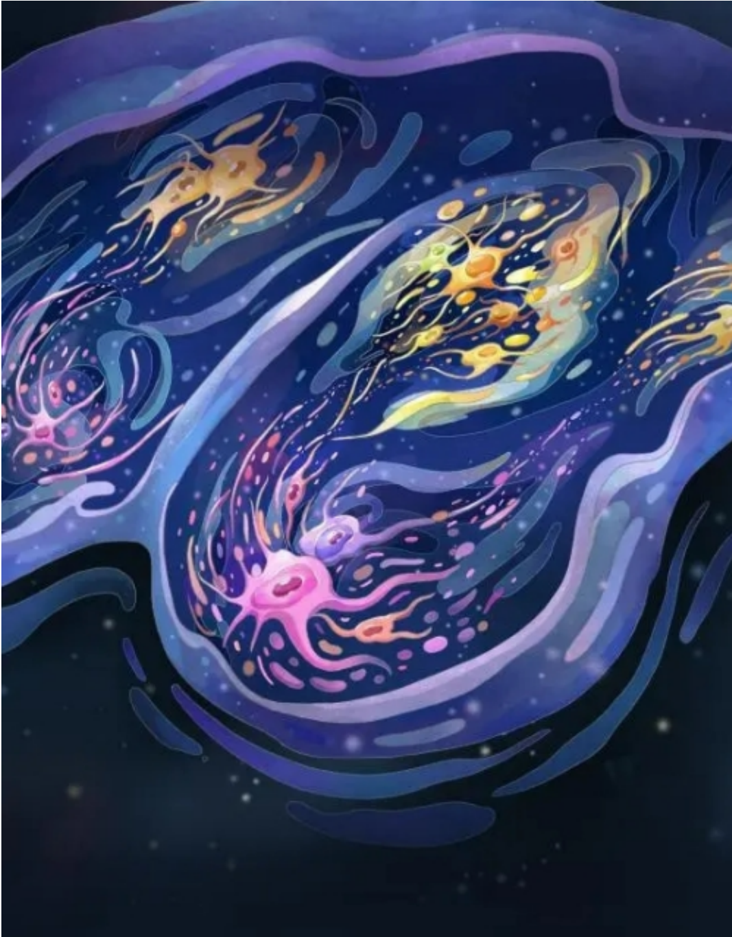
普通狨猴大脑皮层的侧视图（示意图）