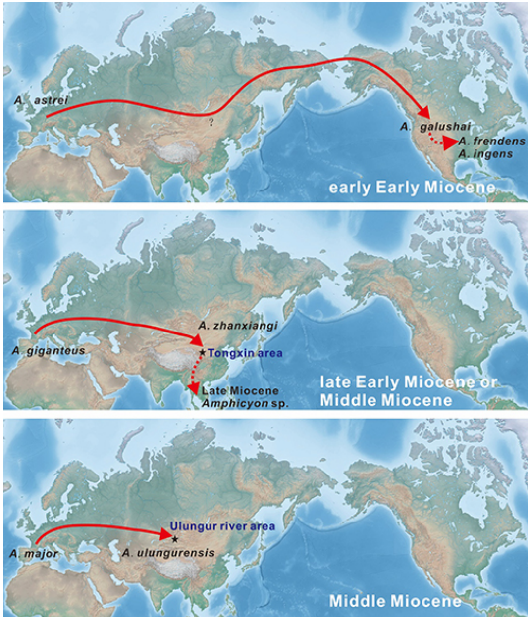
图2. 犬熊属在欧亚北美之间的迁徙示意图

更多 科学进展 请访问 https://www.iikx.com/news/progress/