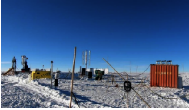
图3.南极昆仑站安装现场

更多 科学进展 请访问 https://www.iikx.com/news/progress/