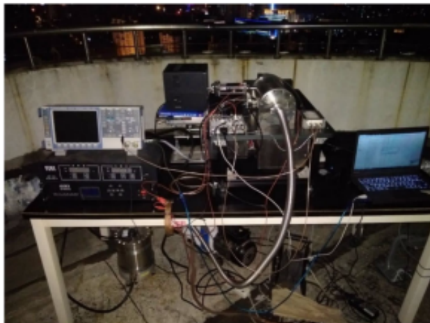
图1.基于InSb的红外天光背景测量仪(左：实验室楼顶测试;右：测试结果)

该工作获得中国科大创新团队培育基金、重要方向培育基金、国家自然科学基金委的资助。