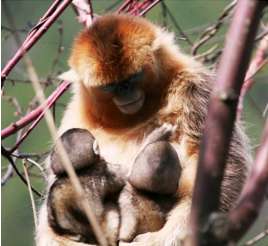
图1. 川金丝猴母猴给同一社会单元的两只婴猴喂奶