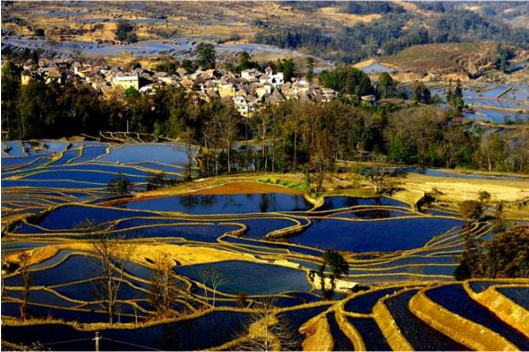
中国稻田生态系统

更多 科学进展 请访问 https://www.iikx.com/news/progress/