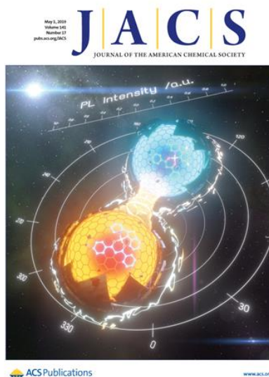
图：结构依赖的多态发光晶体和偏振磷光放大

更多 科学进展 请访问 https://www.iikx.com/news/progress/