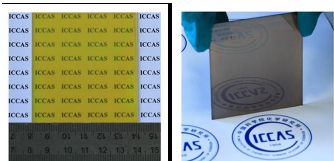
图1 转化前钙钛矿( \text{CH}_3\text{CH}_2\text{CH}_2\text{NH}_3\text{PbI}_3 ,左边)和转换后钙钛矿( \text{CH}_3\text{NH}_3\text{PbI}_3 ,右边)薄膜