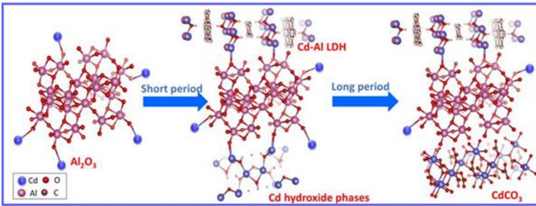
图1 Cd(II)在氧化铝表面的固定机制