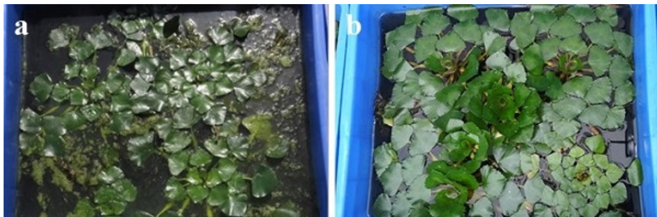
图2 菱角在猪场养殖废水生长状况 (a：第1天；B：第15天)